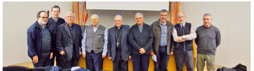
Preveres i diaca presents en la celebració del seu aniversari d'ordenació

Un dinar de germanor on van compartir taula el bisbe, els vicaris, preveres, diaques i personal de la Cúria va concloure aquesta matinal amb fort significat d'Església diocesana.