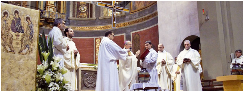
Benedicció dels sants olis

A l mig de la Setmana Santa, el Dimecres Sant, se celebra cada any des de la creació del Bisbat de Sant Feliu de Llobregat, l'eucaristia en la qual es beneeixen els sants olis que durant l'any serviràn per a les uncions als confirmants, catecúmens i malalts.